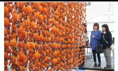
市田柿すだれ (イメージ)

(5) 当選連絡：当選の方には11月02日(金)までに電話もしくは書面にて連絡致します